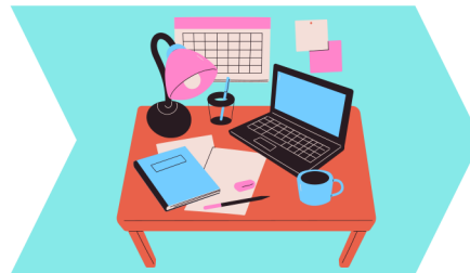
Lernen & Verstehen